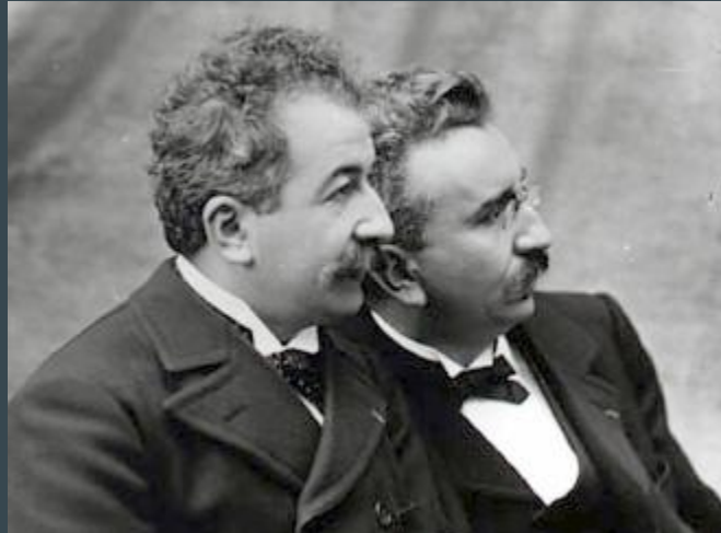
Louis e Auguste Lumière